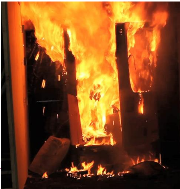
Figur 43: Venstre vindusrute bryter sammen og eksponerer veggflaten for flammer. Tid: 5min og 50s.